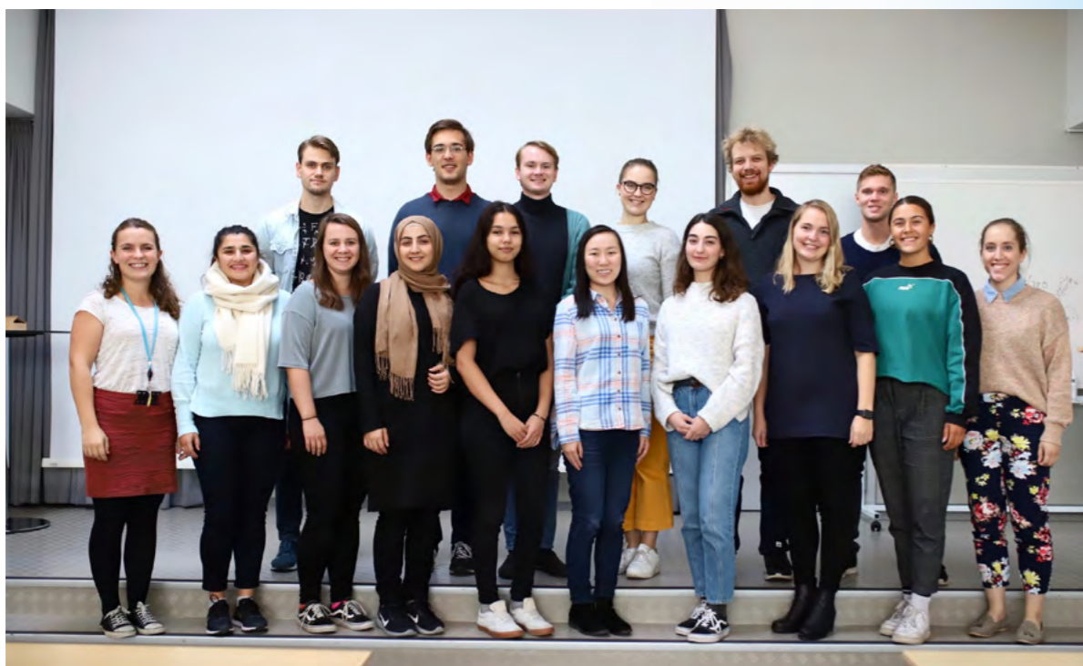
Noen av våre Prepare ambassadører

lærere har deltatt på Kodeskolens dybdekurs i programmering