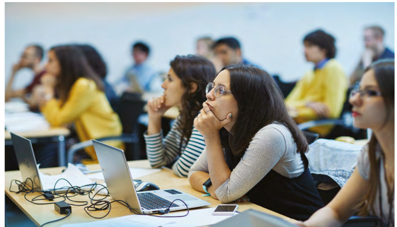
Deltagere på sommerskolen i beregningsorientert fysiologi

Et sammendrag av SSRIs aktiviteter i 2018 presenteres nærmere på de neste sidene.